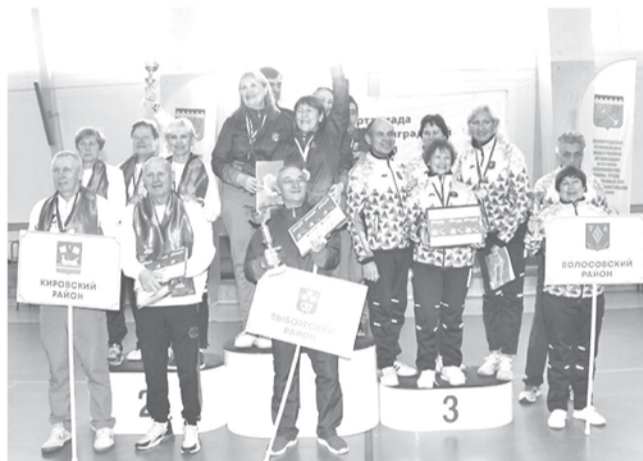
Пьедестал почета Третьей спартакиады ветеранов Ленобласти