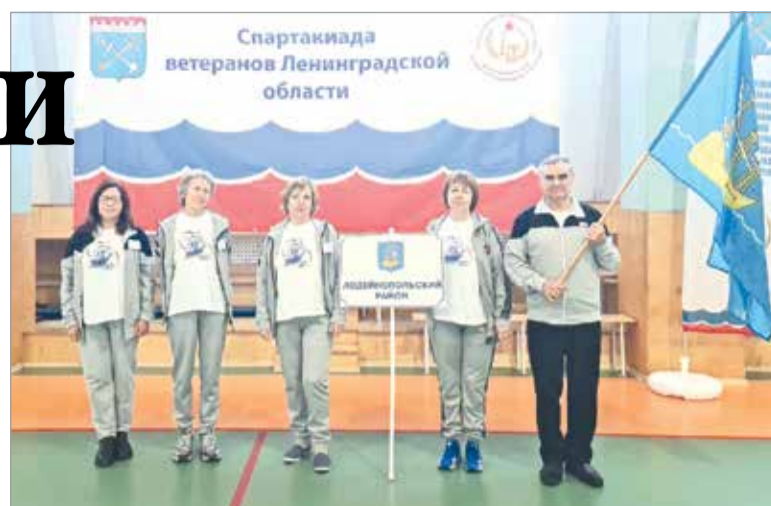
Команда Лодейнопольского района

– Мероприятие действительно получилось очень классное, – по-